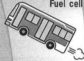
Fuel cell bus